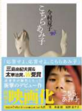
『こちらあみ子』 著：今村夏子 726円