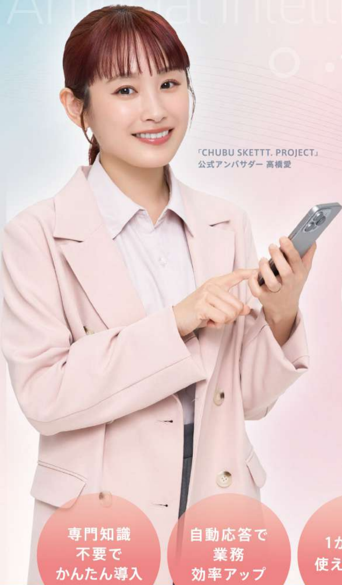
「CHUBU SKETTT. PROJECT」 公式アンバサダー 高橋愛