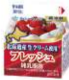
フレッシュ 北海道産 生クリーム使用