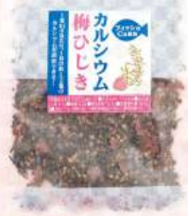
1袋(75g)/賞味期限:常温90日