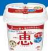
ナチュレ 恵 megumi