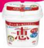
ナチュレ 恵 megumi