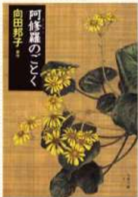
『阿修羅のごとく』 著：向田邦子 869円

向田邦子はなぜ、時代が経っても読み継がれているのか。それは、物語の登場人物の家族や夫婦であるところに、遠慮や気遣いを超えた、徹底して本音で生きている潔さがあるからだと思う。関係性に亀裂が入っても、読んでいてどこかすっきりする。言いたいことを言い合い、何度も仲たがいがいしても、固い絆の血縁関係という信頼がある。己のエゴをぶつけ、傷を付け合う、これが家族の宿命なのか。家族の関係性が希薄な時代だからこそ、家族の物語は必要とされるのか。向田邦子が脚本を書いて約三十五年。何年経っても変わらない家族の普遍的なテーマがここにある。