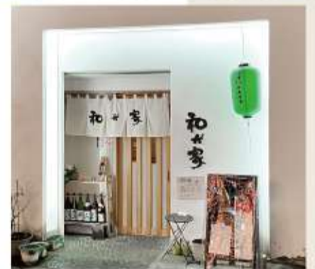
越後料理 和が家 〒950-0087 新潟県新潟市中央区東大通1-5-7 TEL. 050-5488-3602 https://r338400.gorp.jp